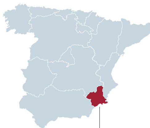
Región de Murcia