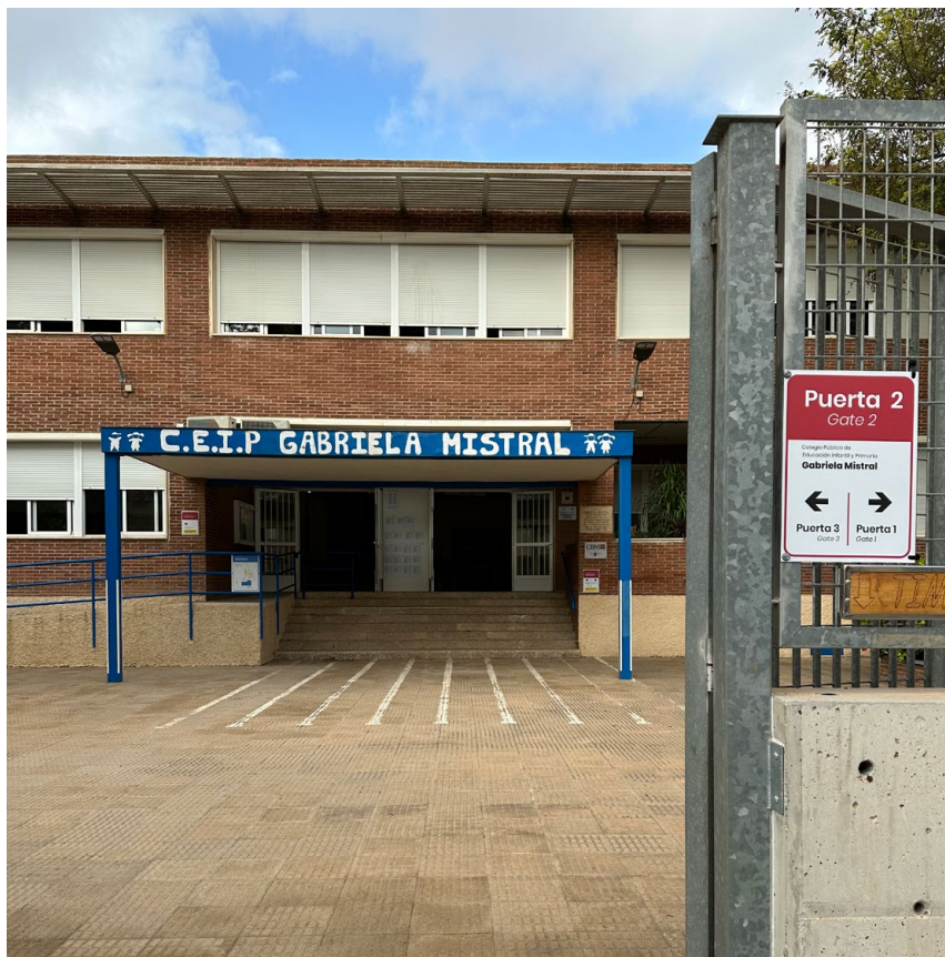
Un colegio público del municipio de Cartagena