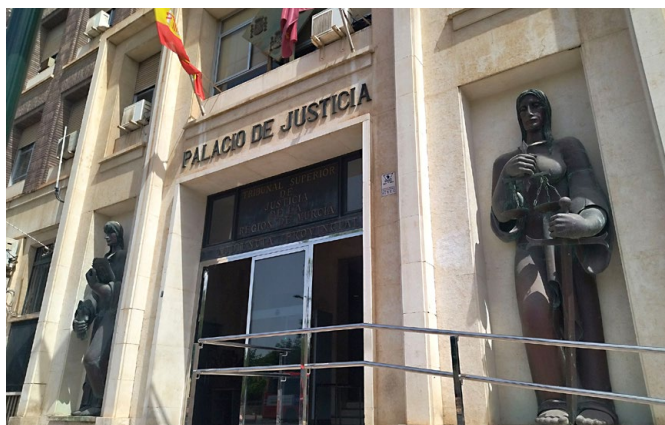
Fachada del Tribunal Superior de Justicia de Murcia

La ley estatal dice cómo se elige al resto de miembros del Tribunal Superior de Justicia.