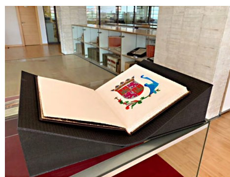
Un ejemplar del Estatuto de Autonomía

Cada Ley se llama con un número y una fecha.