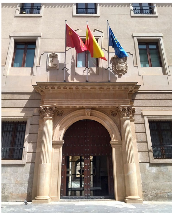
El Palacio de San Esteban