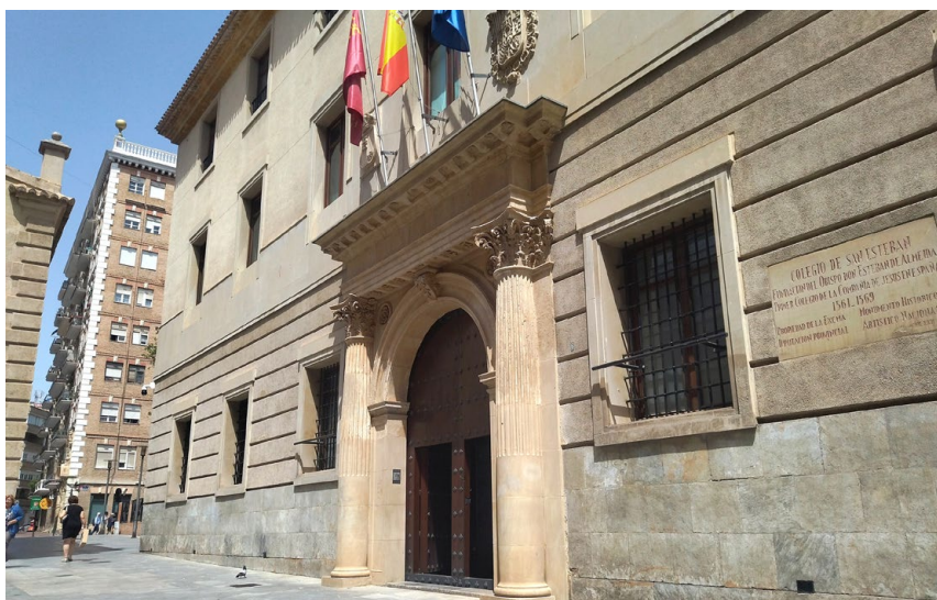
La sede del Gobierno Regional, el Palacio de San Esteban

La Asamblea Regional está en la ciudad de Cartagena.