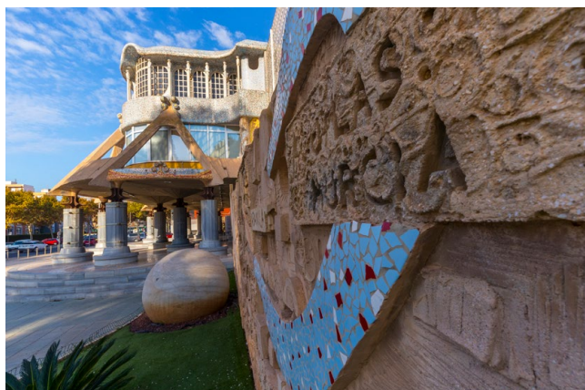
Fachada de la Asamblea Regional