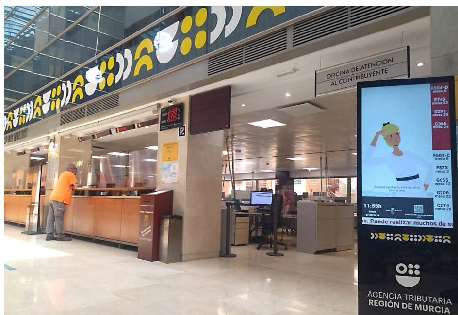
Oficinas de la Administración Tributaria de Murcia