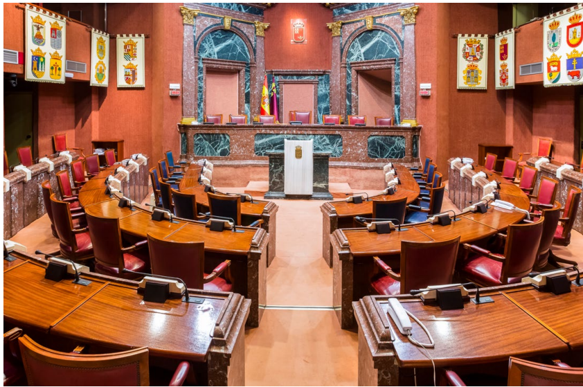
La sala donde se reúne la Asamblea

Ninguna otra persona puede votar por un diputado o diputada.